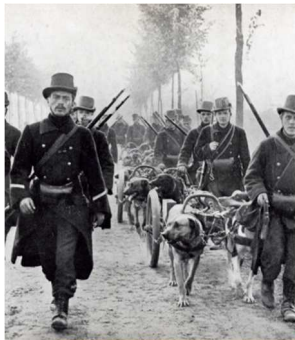
Mitrailleuses tractées par des chiens (armée belge, 1914)

Conclusion générale. E. Baratay (Université de Lyon).