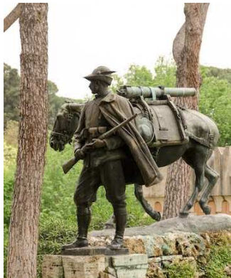
Il mulo degli Alpini Villa Borghese, Rome

Les animaux ont été enrôlés en masse durant la première guerre mondiale. Ce conflit fut le dernier de grande ampleur où la cavalerie ait eu un rôle opérationnel (tout du moins dans les premiers mois). De ce fait, avec un total de 11 millions d'individus, les équidés furent les plus sollicités. A cela, il faut ajouter 100 000 chiens et 200 000 pigeons utilisés par les belligérants des deux camps. Sur l'ensemble du conflit, le nombre de victimes animales se compte en millions.