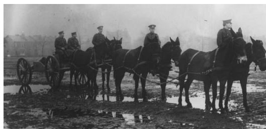
Equipage d'artillerie Britannique (1914)