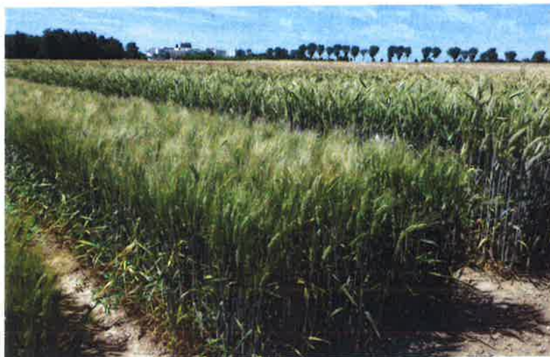
Catherine Guy / BS

Pour qu'une variété soit protégeable, elle doit être distincte de toute autre variété notoirement connue, suffisamment homogène, stable.