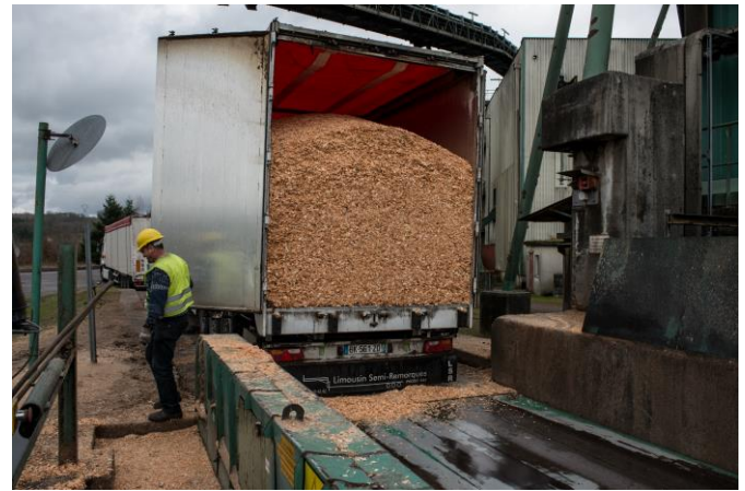
Figure 3. Plaquettes de scierie avant déchargement dans une usine de pâte de cellulose