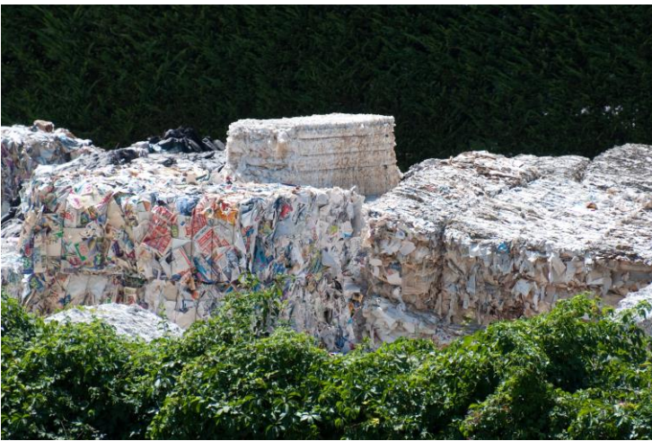
Figure 5. Collecte de papiers récupérés pour le recyclage en Italie

l'industrie papetière utilise le plus largement possible des fibres que des tiers ont certifiées (PEFC, FSC) comme provenant de forêts gérées durablement. Ces systèmes de certification visent à apporter la garantie au consommateur qu'il ne contribue pas à la déforestation.