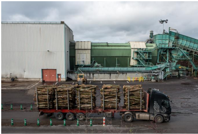
Figure 2. Camion chargé de rondins se dirigeant vers le tambour écorceur d’une usine de pâte