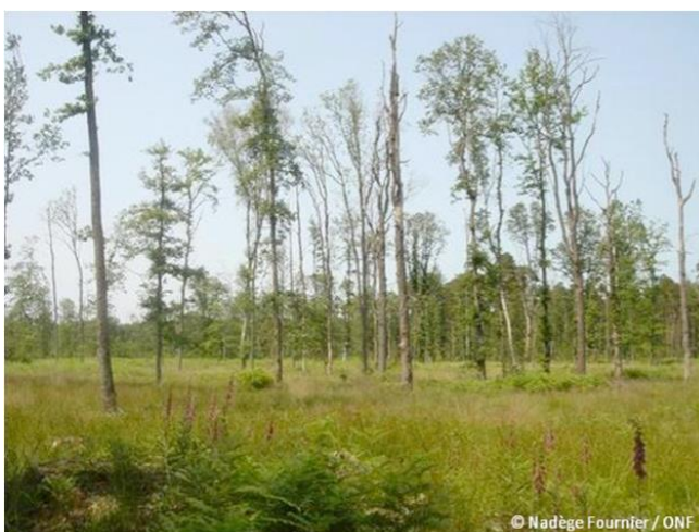
Figure 4. Forêt de chêne pédonculé dépeuplée en Forêt de Vierzon suite à la sécheresse de 2003