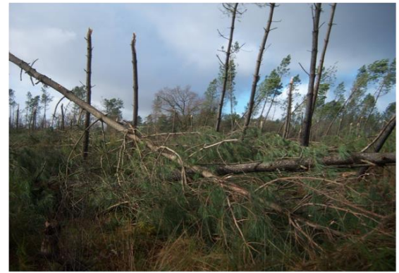
Figure 2. Dégâts de la tempête Klaus (2009) dans une forêt de pin en Aquitaine

Cependant, des phénomènes tels que les vents forts ou les feux n'ont pas toujours un caractère catastrophique du point de vue écologique, sauf quand ils font disparaître des habitats emblématiques ou des populations végétales et animales uniques. Ces « perturbations » sont même l'un des moteurs naturels du fonctionnement des écosystèmes forestiers. Ainsi, le vent en faisant tomber des bouquets d'arbres crée des trouées dans le peuplement permettant la régénération et le développement des jeunes semis, ou encore : la dissémination de certaines espèces méditerranéennes, qui ont co-évolué avec le feu, est favorisée par lui. Le caractère catastrophique des grandes tempêtes et des grands feux tient au fait qu'ils impactent sur de grandes surfaces des écosystèmes et des territoires gérés et/ou habités.