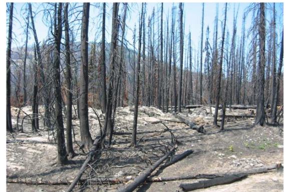
Figure 3. Peuplement de pin d'Alep incendié