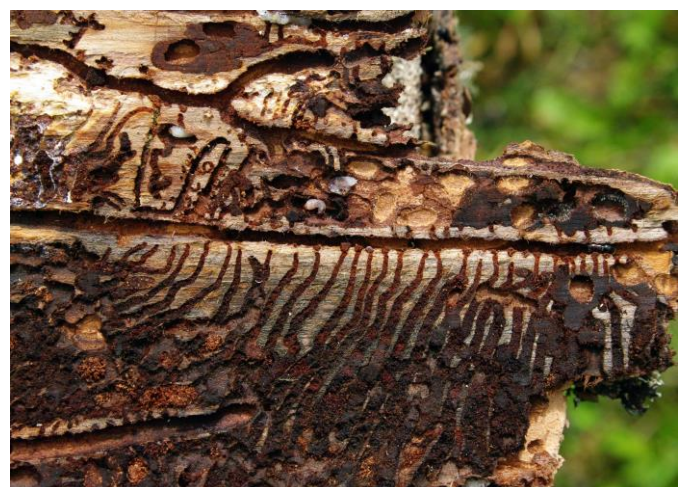
Figure 5. Galeries de scolyte typographe sur épicéa