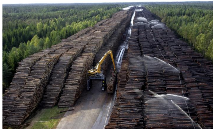
Figure 2. Après la tempête Gudrun en Suède (2005), piles de bois (13 m de haut, 1 km de long) stockées sous aspersion sur l'aérodrome désaffecté de Byholma totalisant 1 million de m 3

Les dommages aux arbres se classent en trois catégories : i) les dégâts primaires, visibles juste après la tempête ; de type mécanique, ils se traduisent par la casse du tronc et/ou le renversement des arbres (fig.1) ; ii) les dégâts secondaires différés dans le temps : attaques d'insectes sous corticaux ou autres bio-agresseurs, et aussi feu, neige ou glace, voire d'autres coups de vent ; iii) les dégâts tertiaires, comme les pertes de production d'arbres détruits avant l'âge optimum d'exploitation. Responsables de plus de la moitié des dommages forestiers catastrophiques observés en Europe au cours des dernières décennies, les tempêtes sont, de loin, le premier facteur de pertes. On évalue généralement ces dégâts en volume de bois. La traduction complète de ces dommages en termes économiques doit prendre en compte : les préjudices liés à : la baisse des prix du bois rendu usine, due à l'engorgement des marchés ; la dépréciation de la qualité du bois ; la hausse des coûts d'exploitation ; les coûts additionnels éventuels de transport à longue distance et de stockage (au titre des dommages primaires) (fig.2); les coûts additionnels dus à la dispersion des bois victime des dommages secondaires ; les pertes financières liées aux dommages tertiaires.