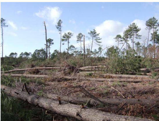
Figure 1. Dégâts en forêt landaise de pin maritime (tempête Klaus de janvier 2009

Le vent, y compris dans sa forme extrême, la tempête, participe à la dynamique naturelle des écosystèmes forestiers en renversant de vieux arbres, créant ainsi des trouées plus lumineuses où pourra s'effectuer la régénération. Dans les forêts aménagées et gérées par l'homme, ces perturbations peuvent cependant avoir un impact considérable en termes économiques, sociaux et environnementaux, lorsque des phénomènes tempétueux brutaux affectent de vastes territoires. En Europe occidentale, outre les vents violents liés à des orages mais dont l'impact est local, les fortes tempêtes, liées à la circulation atmosphérique générale, se produisent principalement en hiver (décembre, janvier) et surtout aux latitudes moyennes. Les dégâts potentiels maximums sont fortement corrélés à la vitesse ( v ) des rafales de vent. Ils sont faibles pour v < 120 km/h, modérés pour 120 < v < 145 , importants pour 145 < v < 160 , très sévères si v > 160 km/h.