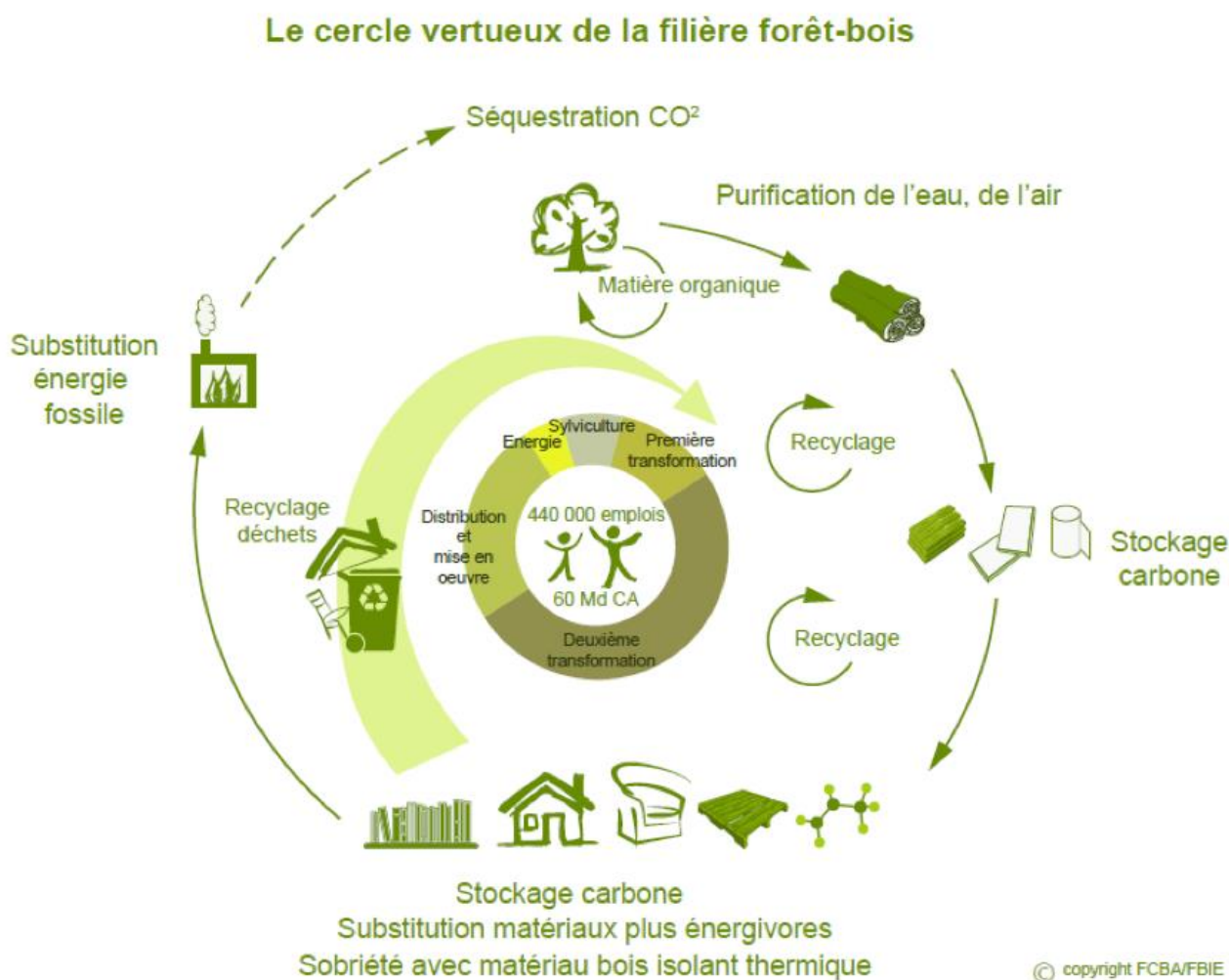
Figure 1. Cercle vertueux de la filière forêt-bois

Un des principaux outils de ce projet est la mise en œuvre d'un Fonds Forestier Stratégique Carbone (FFSC) . Celui-ci sera alimenté par 25% des montants annuels issus de la mise aux enchères des quotas carbone et aura pour but de financer des reboisements et des actions collectives (promotion, innovation).