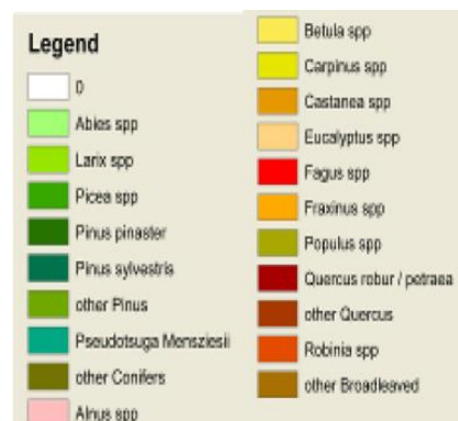
Figure 1. Distribution des essences en Europe