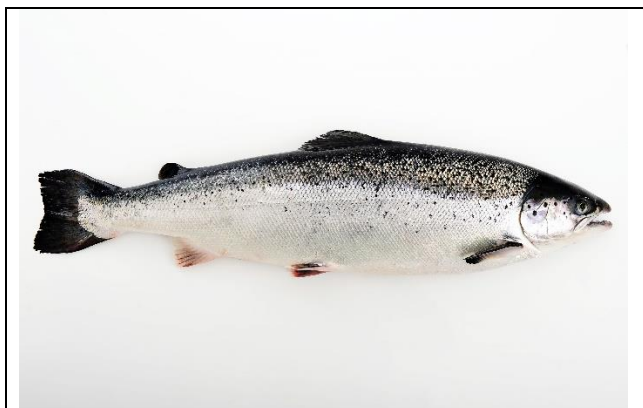
Figure 3 : Saumon atlantique ( Salmo salar ).

La plupart des populations d'aquaculture continue à avoir des liens étroits avec les populations naturelles. Il peut s'agir de prélèvement de juvéniles ou de reproducteurs dans le milieu naturel pour alimenter les élevages ou, à l'inverse, d'introductions volontaires (repeuplements) ou fortuits (échappement des enceintes d'élevage). Un cas intermédiaire est le relâcher délibéré d'animaux que les aquaculteurs jugent « peu performants » et ne souhaitent pas conserver en élevage. L'aquaculture norvégienne de saumon atlantique ( Figure 3 ) fournit un exemple spectaculaire et quantifié d'échappement de poissons d'élevage dans le milieu naturel.