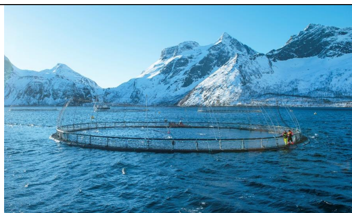
Figure 4 : Cage flottante d'élevage de saumon atlantique dans un fjord norvégien.

Chaque année, les statistiques officielles de la direction norvégienne des pêches enregistrent le nombre déclaré par les aquaculteurs de saumons échappés des cages ( Figure 4 ), sans doute largement sous-estimé ( Figure 5 ).