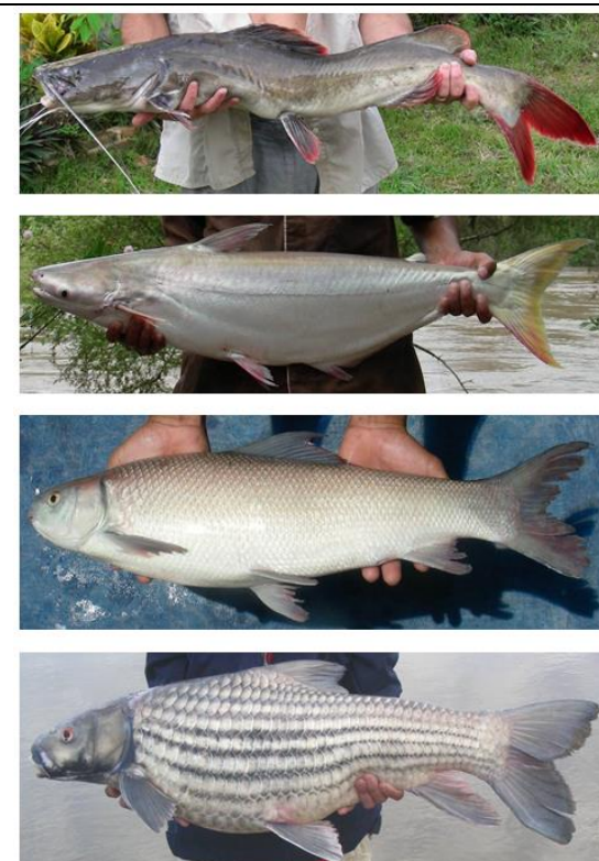
Figure 2 : De haut en bas : H. wyckioides , P. krempfi , C. microlepis et P. jullieni , quatre espèces du fleuve Mékong en début de phase de domestication.

La pisciculture dans le bassin du Mékong repose, pour une bonne part, sur la production d'espèces indigènes. La domestication est une pratique traditionnelle dans le prolongement de la pêche. Aujourd'hui, 32 espèces indigènes sont produites à des niveaux divers. Le poisson-chat, Pangasianodon hypophthalmus , domine largement avec une production annuelle de plus d'un million de tonnes, suivi par trois espèces avec plusieurs dizaines de milliers de tonnes produites pour chacune. Elles sont bien adaptées aux conditions d'élevage de la région, étangs, cages et rizipisciculture, et elles peuvent être produites à différents niveaux d'intensification. Le rendement en étangs est généralement élevé avec les espèces qui ont une respiration aérienne complémentaire (jusqu'à 500 t/ha/an de P. hypophthalmus en enclos dans le Mékong). La disponibilité en alevins constitue le principal facteur déterminant dans le choix des espèces, suivi par la rusticité et la valeur marchande. Le régime alimentaire intervient peu, mais ce paramètre va devenir important compte tenu de la raréfaction du poisson fourrage utilisé traditionnellement. Par ailleurs, le contexte évolue rapidement avec la diminution des stocks de populations naturelles de poissons, l'introduction d'espèces exotiques et la production d'hybrides pour la pisciculture. La domestication devient alors un moyen privilégié de préserver la biodiversité ; les programmes de R&D en cours concernent surtout 4 espèces présentées en Figure 2.