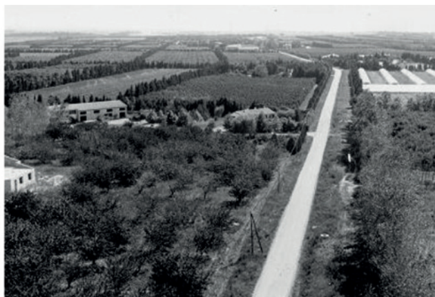
La diversification des cultures et des paysages dans le Gard, grâce à l'irrigation. Photo de gauche : Au début des années 1960. Photo de droite : Après la mise en valeur du territoire.