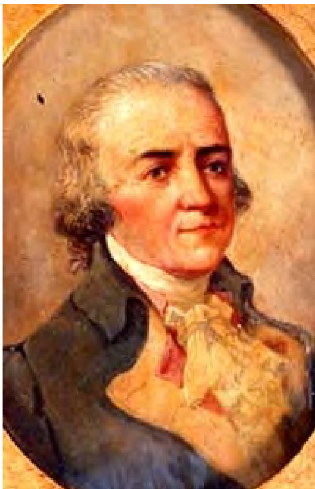
Figure 1. Pierre Samuel Dupont de Nemours (1739-1817), Économiste, éditeur, homme politique. Portrait réalisé par un peintre inconnu.

Dès sa jeunesse, marquée par une relation difficile avec son père, horloger à Paris, qui espérait lui voir prendre sa suite, Pierre-Samuel Dupont 1 (1739-1817) a fait preuve d'un grand éclectisme, cherchant sa voie en s'intéressant à des domaines tels que le génie militaire, la médecine ou les belles-lettres. En 1759, il n'a que vingt ans lorsqu'il présente au duc de Choiseul (1719-1785), nouveau secrétaire d'État aux