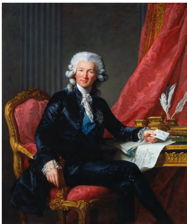
Figure 3. Charles-Alexandre de Calonne (1734-1802), Contrôleur général des Finances. Portrait réalisé en 1784 par Élisabeth Vigée-Lebrun, Royal Collection, Londres.

Il est arrêté de transmettre ce mémoire au contrôleur général et de lui demander d'écrire au garde des Sceaux pour avoir communication d'un projet de loi rédigé afin de régler les dîmes dans la province de Normandie. Cette proposition très construite allait donc beaucoup plus loin que le but initial proposé au groupe lors de la sécheresse du printemps 1785. Elle fait partie d'un bouquet de suggestions émises par divers membres du Comité portant sur la manière de produire et débouchant sur la mise en lumière des freins considérables qui s'opposent au développement de l'agriculture. Ce bouquet de suggestions, le plus souvent dérangeantes pour l'ordre établi, culminera en juillet 1787 avec le rapport présenté par Lavoisier.