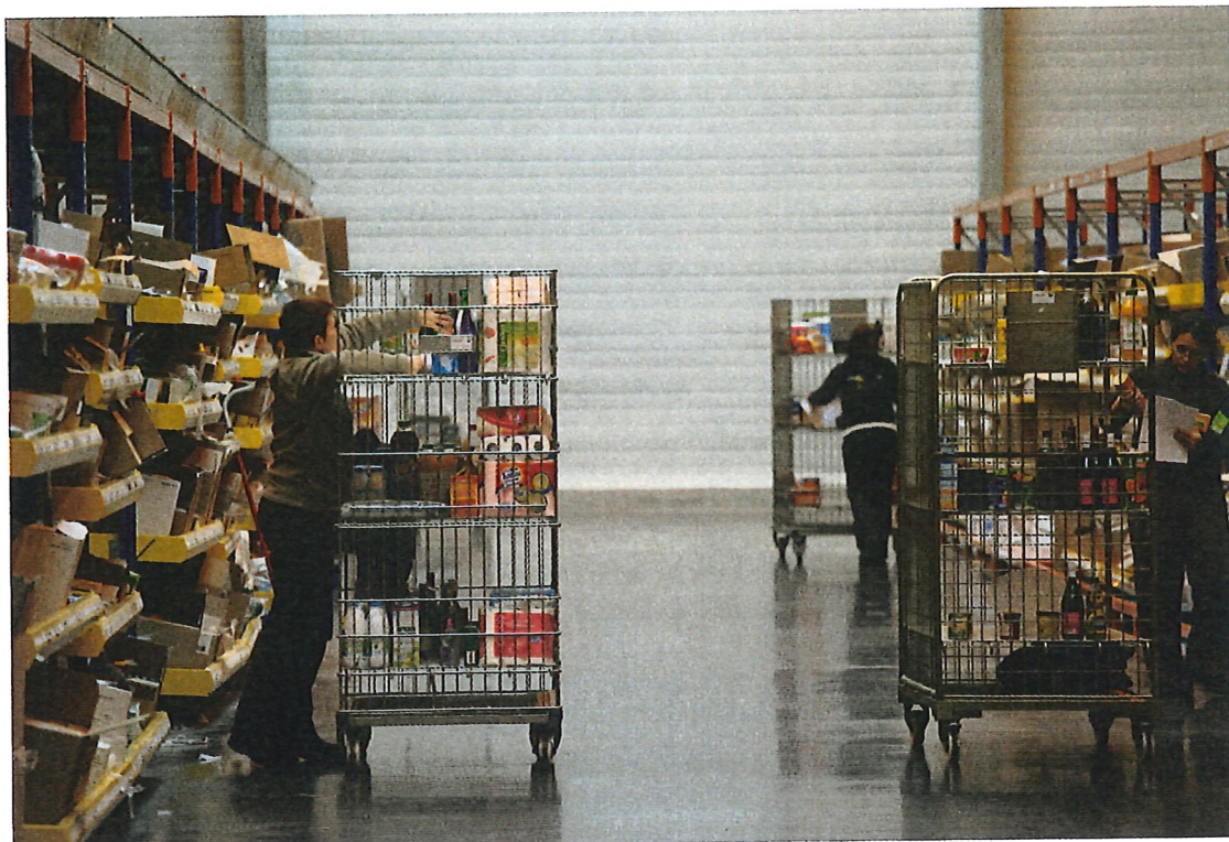
Préparation des commandes dans la zone de stockage d'une entreprise spécialisée dans livraison à domicile d'épicerie et de produits frais commandés en ligne