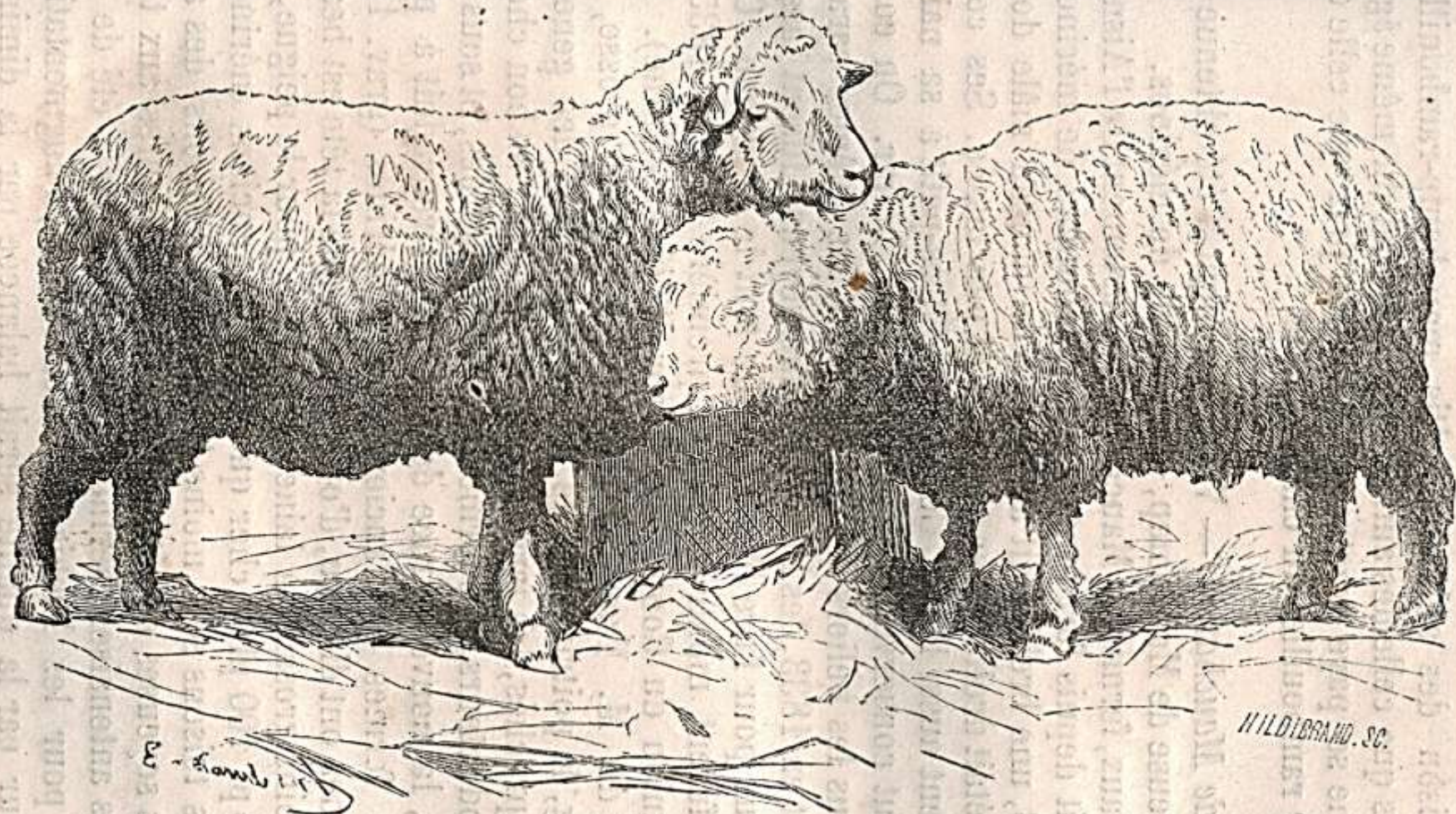
Grav. 48. — Brebis mauchamp, duM troupeau de. Graux.